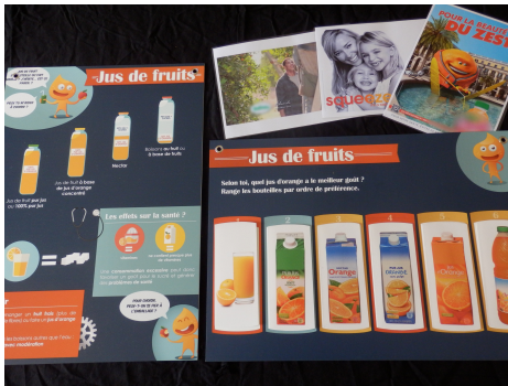
Boissons, stratégies marketing (outil) (2015)