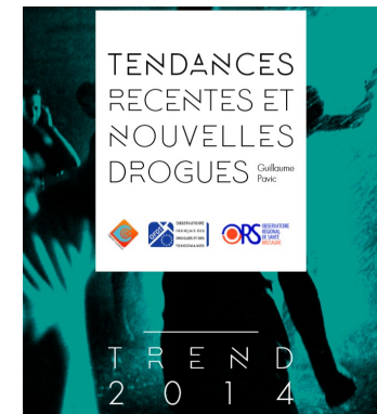
Usages de drogues, TREND (rapport) (2016)