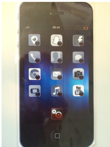
Usages numériques (outil) (2016)