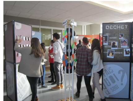
Usages de drogues, soirées, sexualité (outil) (2014)