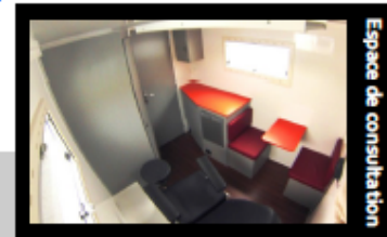
Espace de consultation