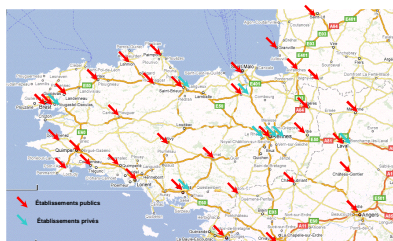
Services d' Accueil Urgent susceptibles de prescrire un TPE

Dans l'attente du site internet du COREVIH, se document pourra vous être envoyé sur demande.